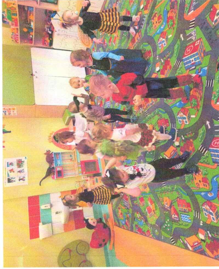
Pożegnanie 3 - latków